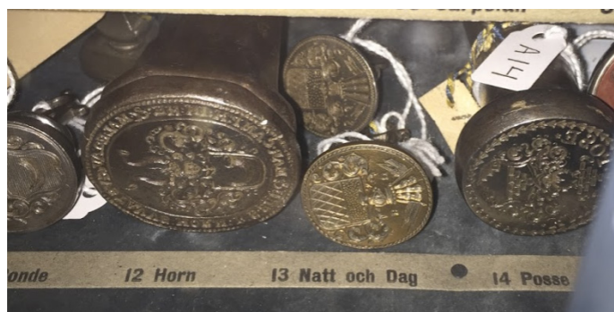
Natt och Dag sigill