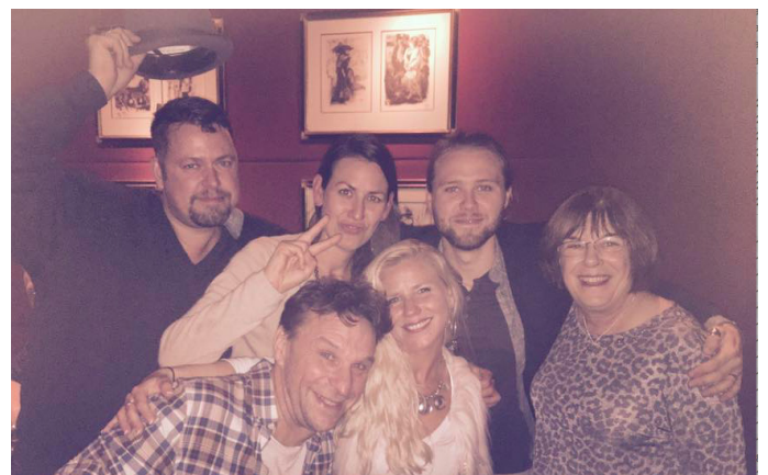
Anders and the cast in New York